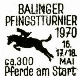
Balingen Pfingstturnier 1970 16.17.18. Mai