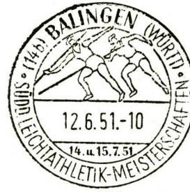
Südd. Leichtathletik- Meisterschaften 14.7. – 15.7.1951