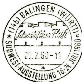
Schwäbischer Fleiß vom 16. – 24. Juli 1960