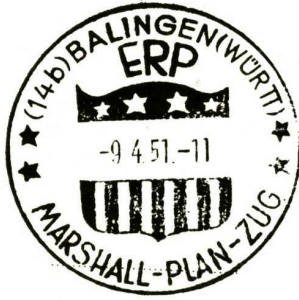
Marshall-Plan-Zug 9. u. 10. 4. 1951