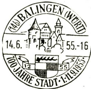
700 Jahre Stadt Balingen 1955

Im Jahre 1951 wurden die Leistungen, die durch das E uropean R ecovery P rogramm möglich geworden waren, in einem Zug gezeigt, der auch 2 Tage in Balingen hielt.